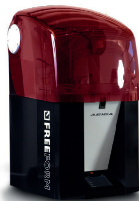
Abb. 9: Seit einiger Zeit ist der 3-D-Druck im Labor fest etabliert (ASIGA Pro2, dentona).

Vorteile des Druckens sind zum einen die reinen Materialkosten, die vergleichsweise gering sind. Beim Fräsen sind die Materialkosten (Blank) hoch; es bleibt viel Abfall übrig. Hingegen wird beim Drucken nur das wirklich benötigte Material verbraucht. Zudem ist die Geschwindigkeit der Fertigung beim Drucken gegenüber der Frästechnologie überlegen. Die Fertigungsaufteilung auf Drucken und Fräsen entlastet zudem unsere Fräsanlagen. Mit Etablierung des 3-D-Druckers haben wir uns wieder mehr Fräskapazität für subtraktiv zu erstellende Produkte geschaffen. Hinzu kommt, dass mit der Drucktechnik insbesondere bei sehr komplexen Zahnstellungen eine deutlich höhere Passung erzielt werden kann, da auch unter sich gehende Bereiche optimal gedruckt werden. Hier stößt die Frästechnik an ihre Grenzen.